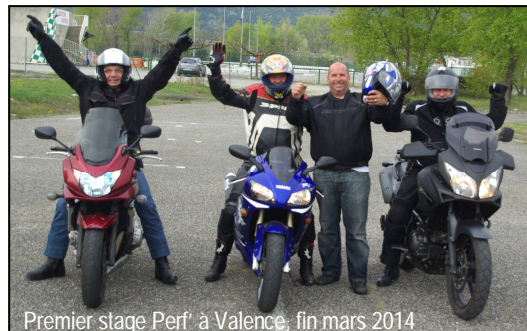
Premier stage Perf' à Valence, fin mars 2014

de guidon » est déjà prévue le 15/04 en collaboration avec la FFMC, un démarrage sur les chapeaux de roues pour l'association !