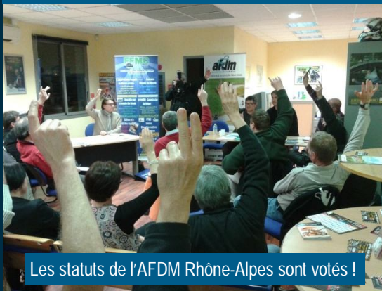
Les statuts de l'AFDM Rhône-Alpes sont votés !

La création d'une nouvelle AFDM Locale est toujours un événement très attendu ! Avec trois en autant d'années et une quatrième bien engagée, le développement associatif est plus vivace que jamais.